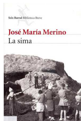
Cubierta La sima